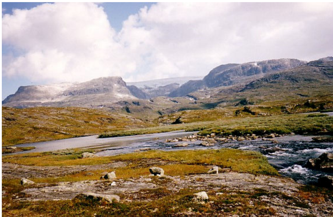
Hardangervidda med Hardangerjøkulen i bakgrunnen. Uberørt natur heldigvis.