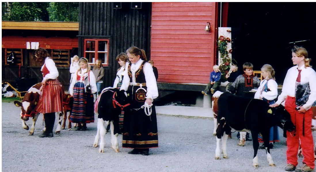
Glimt frå Dyrskun i Seljord på fredagen. Fine kalvar som vises fram av ungdom. Det var stil og kvalitet på eindel av det som vart synt fram på Dyrskun.

Oppsummert tykkjer eg det vart for lite dyr og for mykje salsbuer, som ein finn på alle andre marknader, men det var visst eitt eller anna virus på gang dyra imellom, så da så.